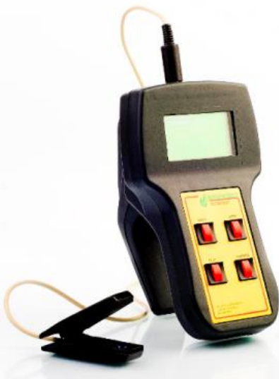
РИС. 2. Прилад сімейства «Флоратест»