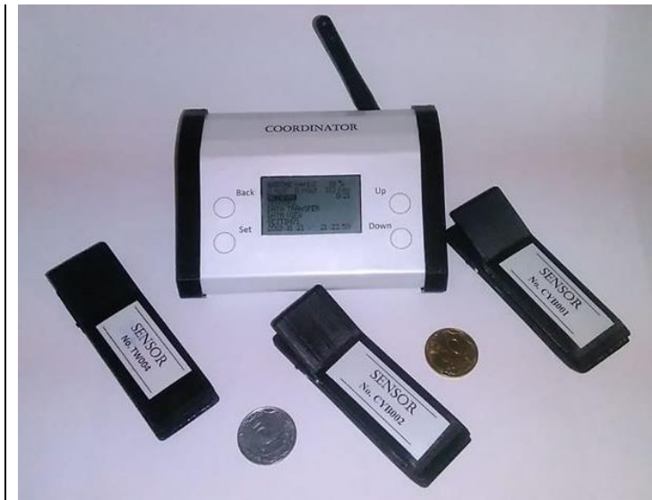
РИС. 3. Дослідний взірець бездротової сенсорної мережі